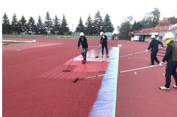
エンボス層設置状況