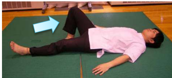
図3-1 ひざの曲げ伸ばし運動