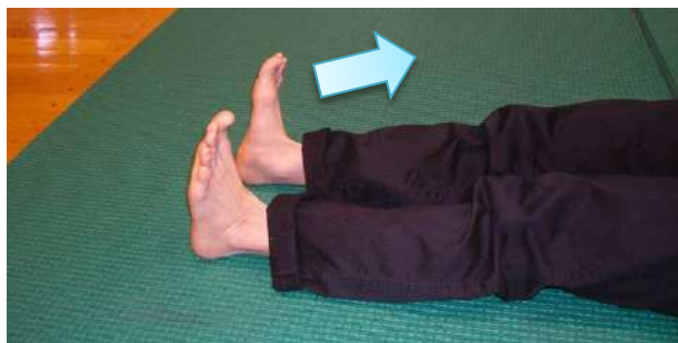
図4-1 ひざの曲げ伸ばし運動