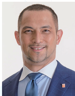
スポーツ庁長官 室伏 広治