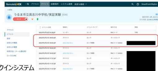
↑スマートロック履歴管理