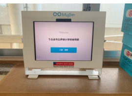
↑スマートロック及びセルフチェックインシステム ←外部指導者による実施の様子