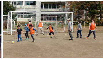
ウォーキングサッカー