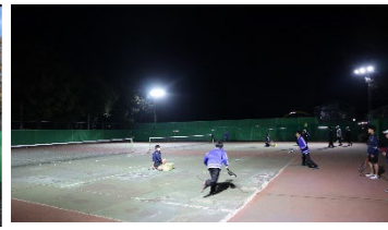
テニスコート夜間照明