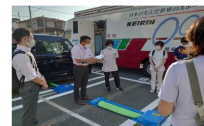
◀▲ スタンディングワーク