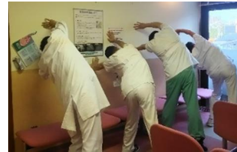
▲ 業務の間のストレッチ