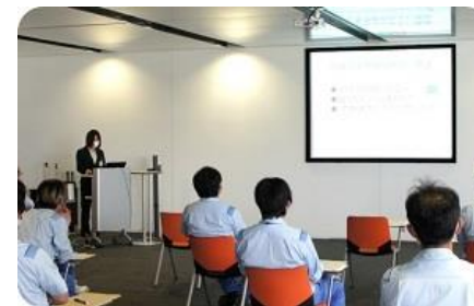
▲『いきいき指導』健康講話