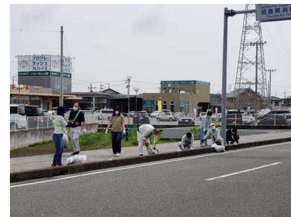
▲フジタアドプトお遍路さん