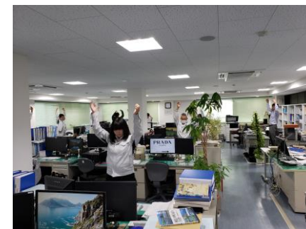
▲どこでもラジオ体操