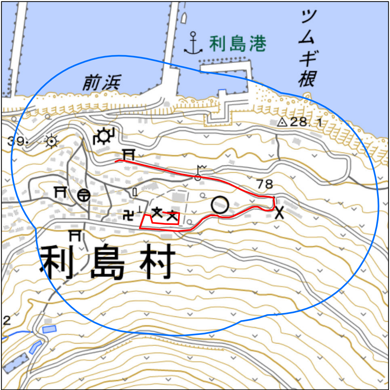
対象大会関係施設の区域