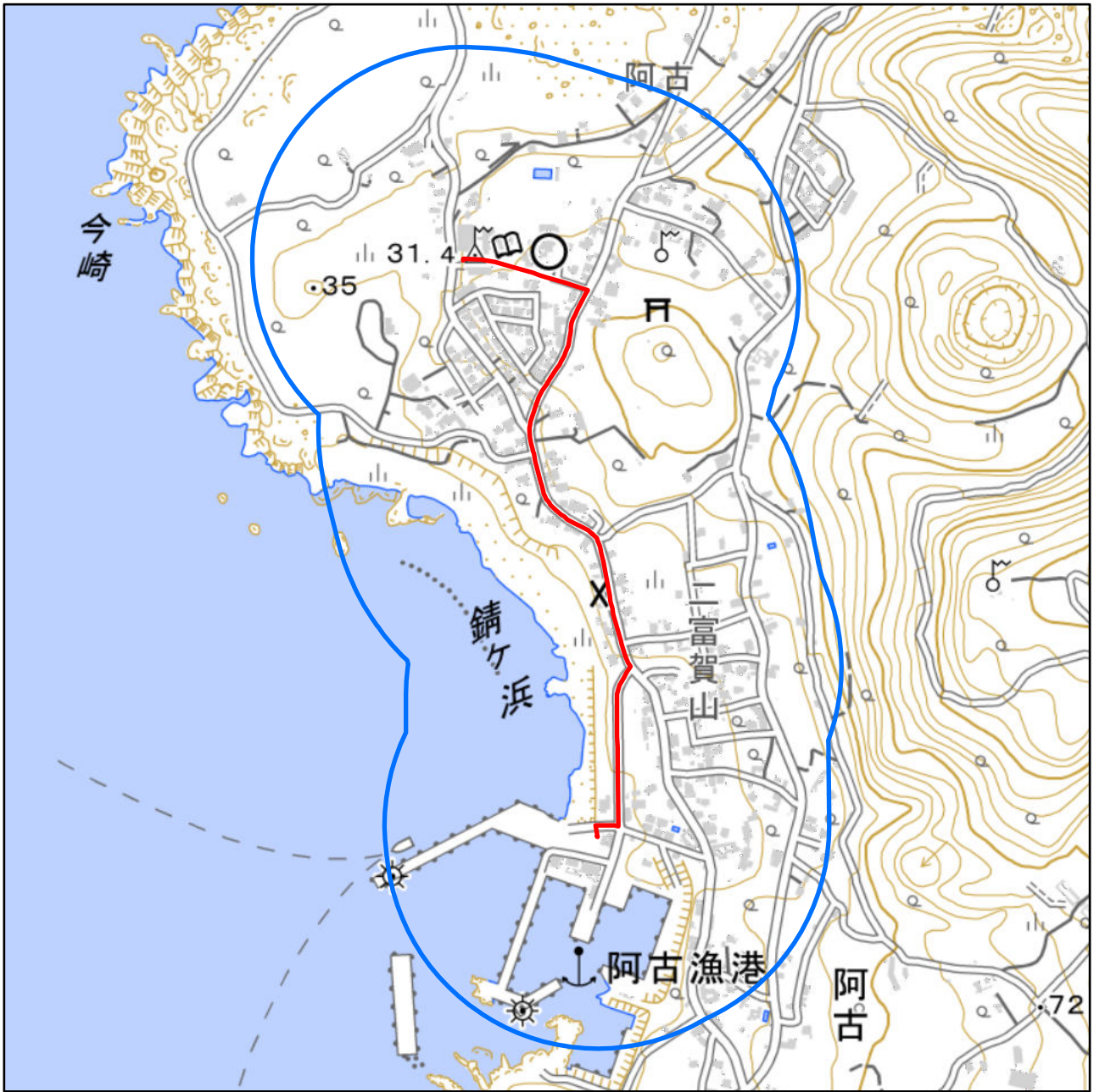
対象大会関係施設の区域