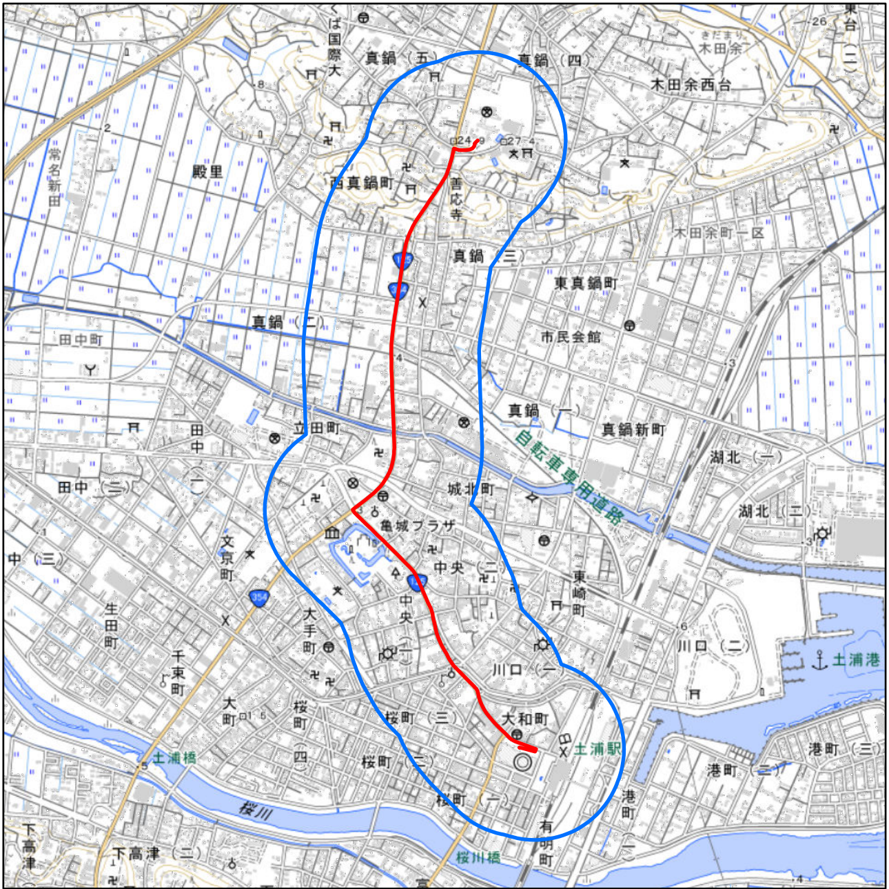
対象大会関係施設の区域