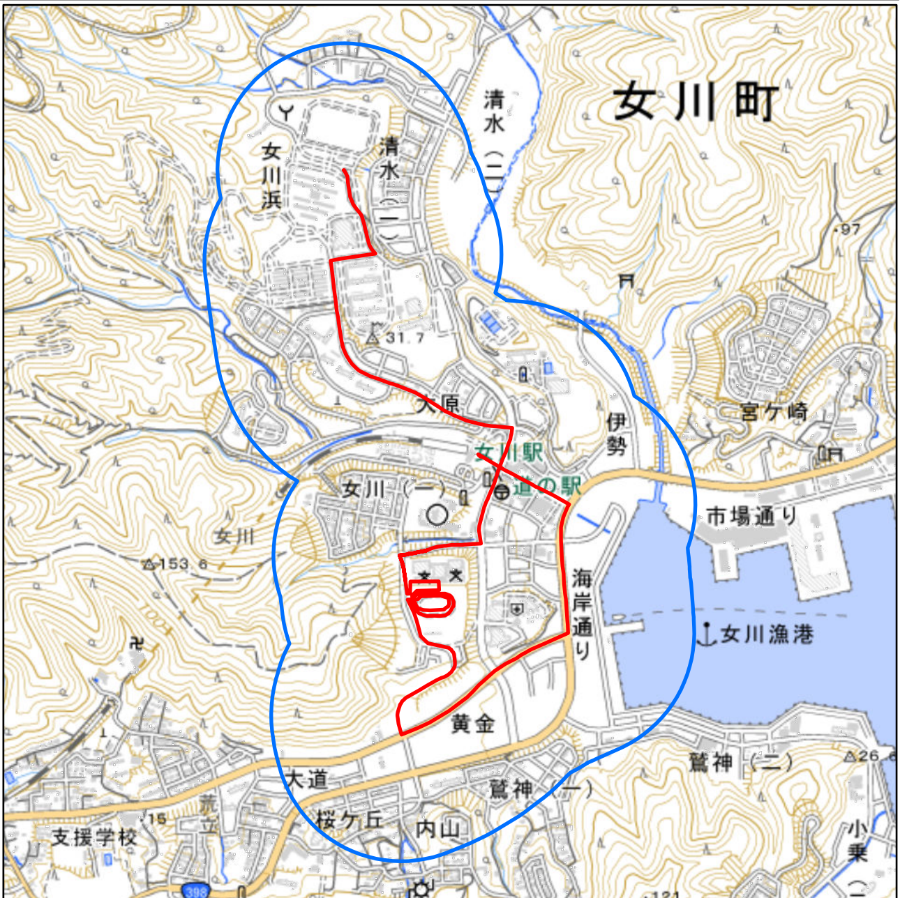
対象大会関係施設の区域