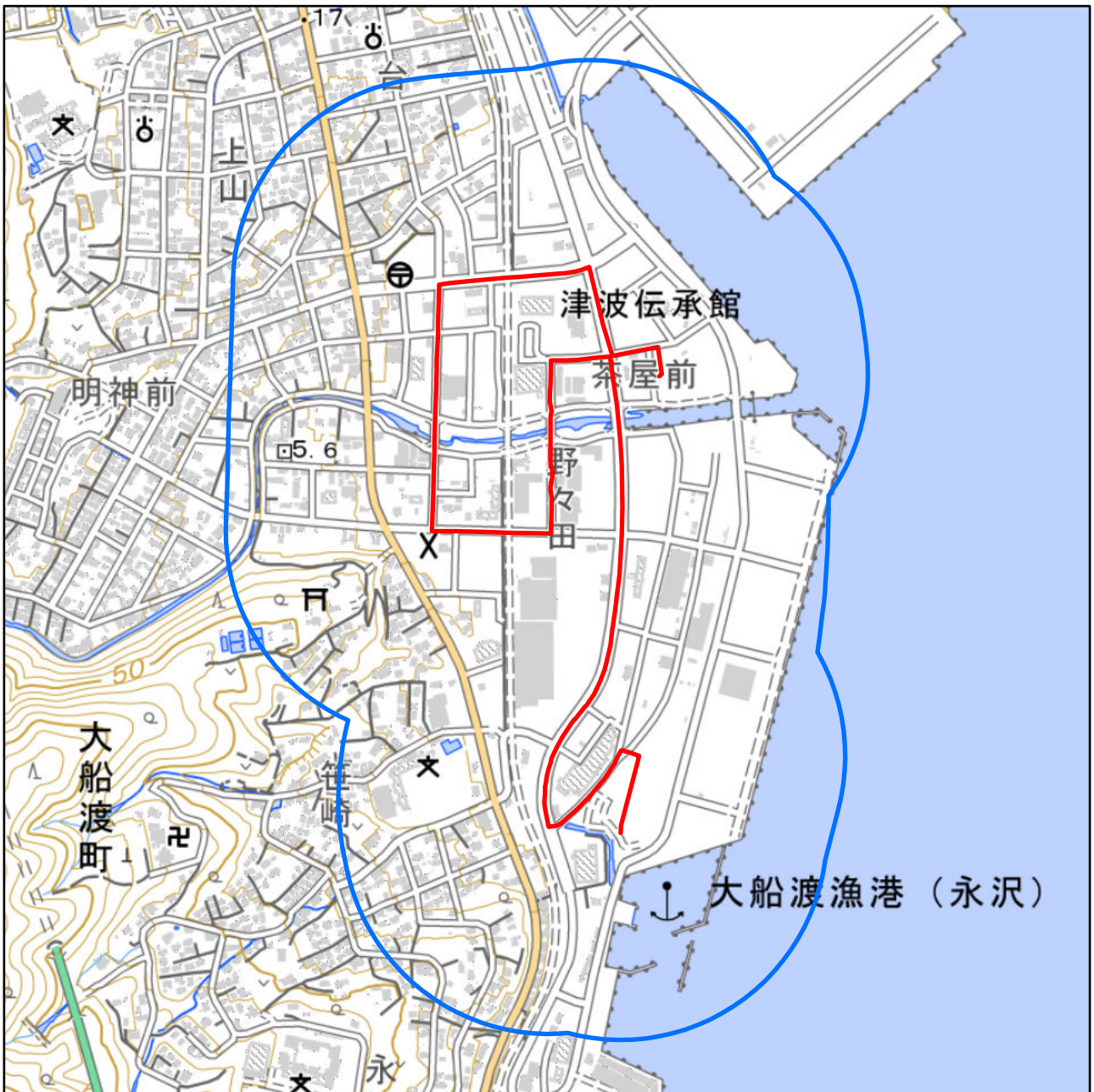
対象大会関係施設の区域