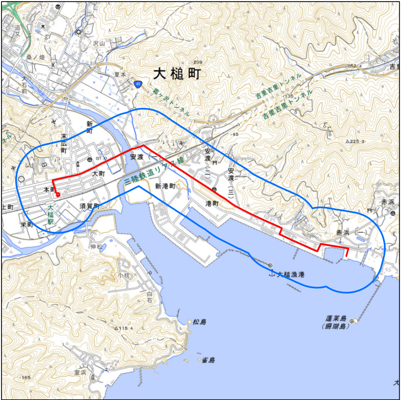
対象大会関係施設の区域