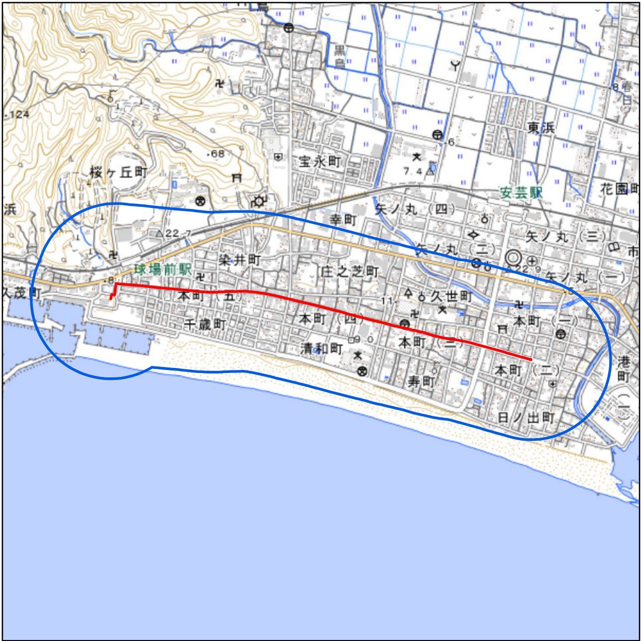
対象大会関係施設の区域