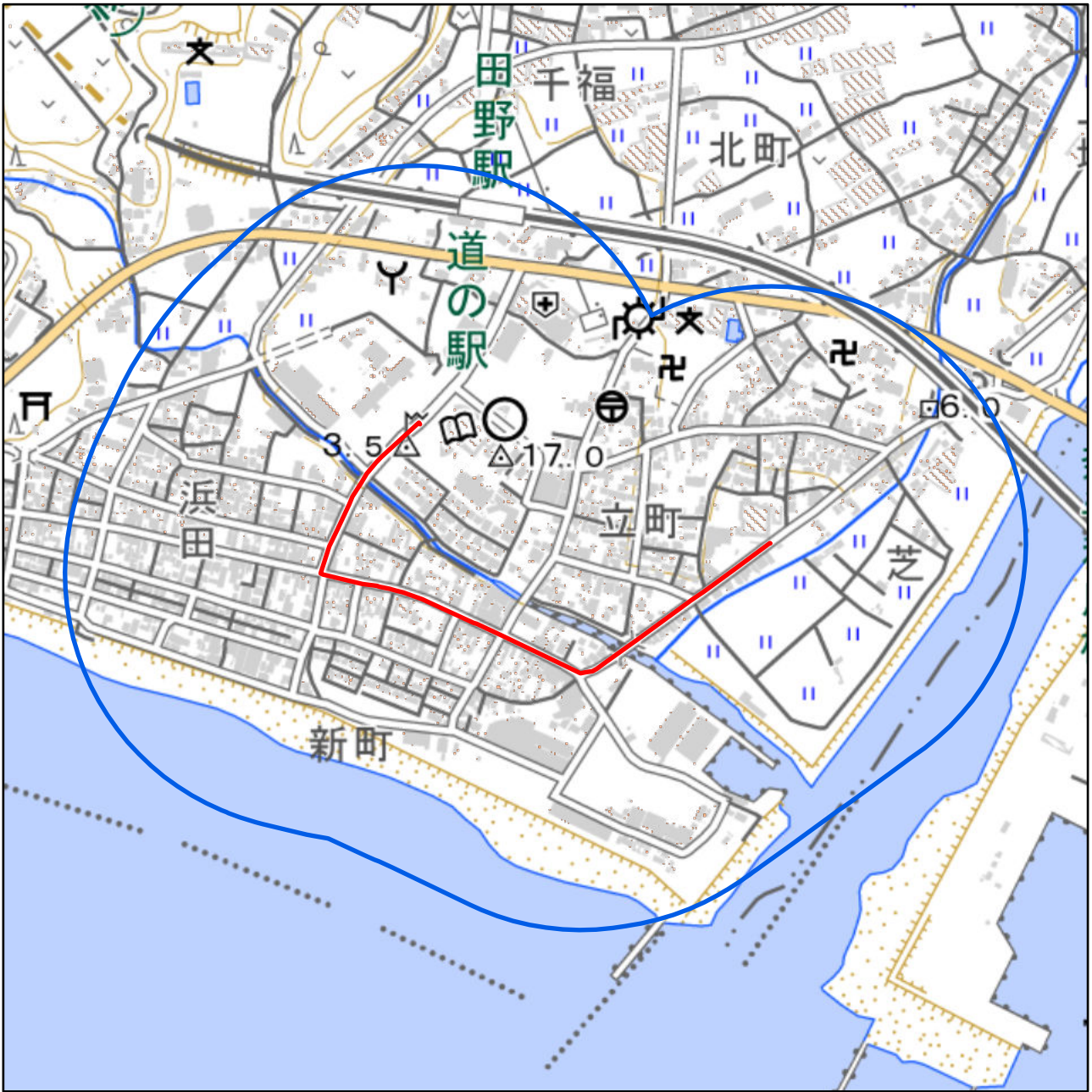
対象大会関係施設の区域