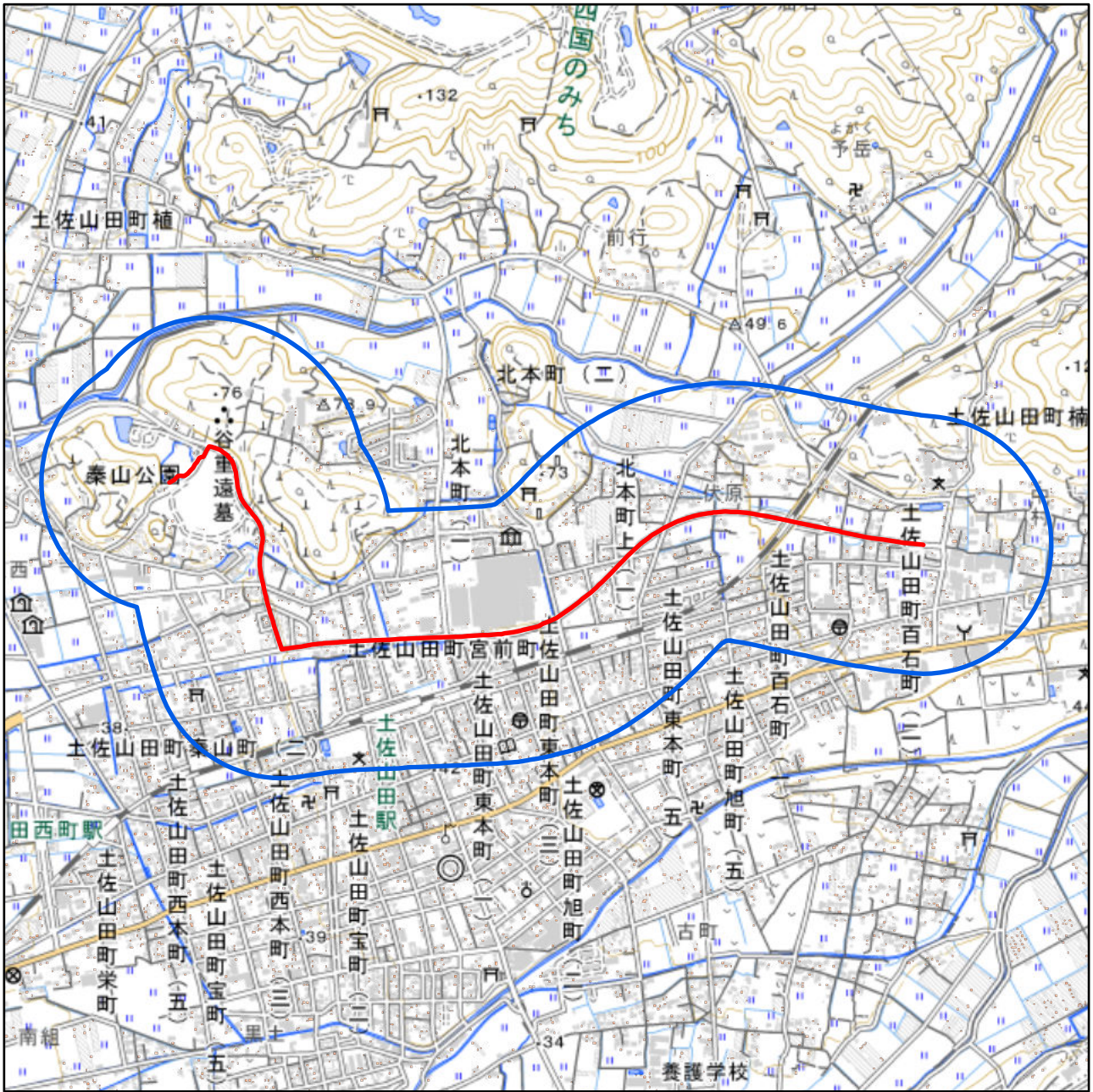
対象大会関係施設の区域