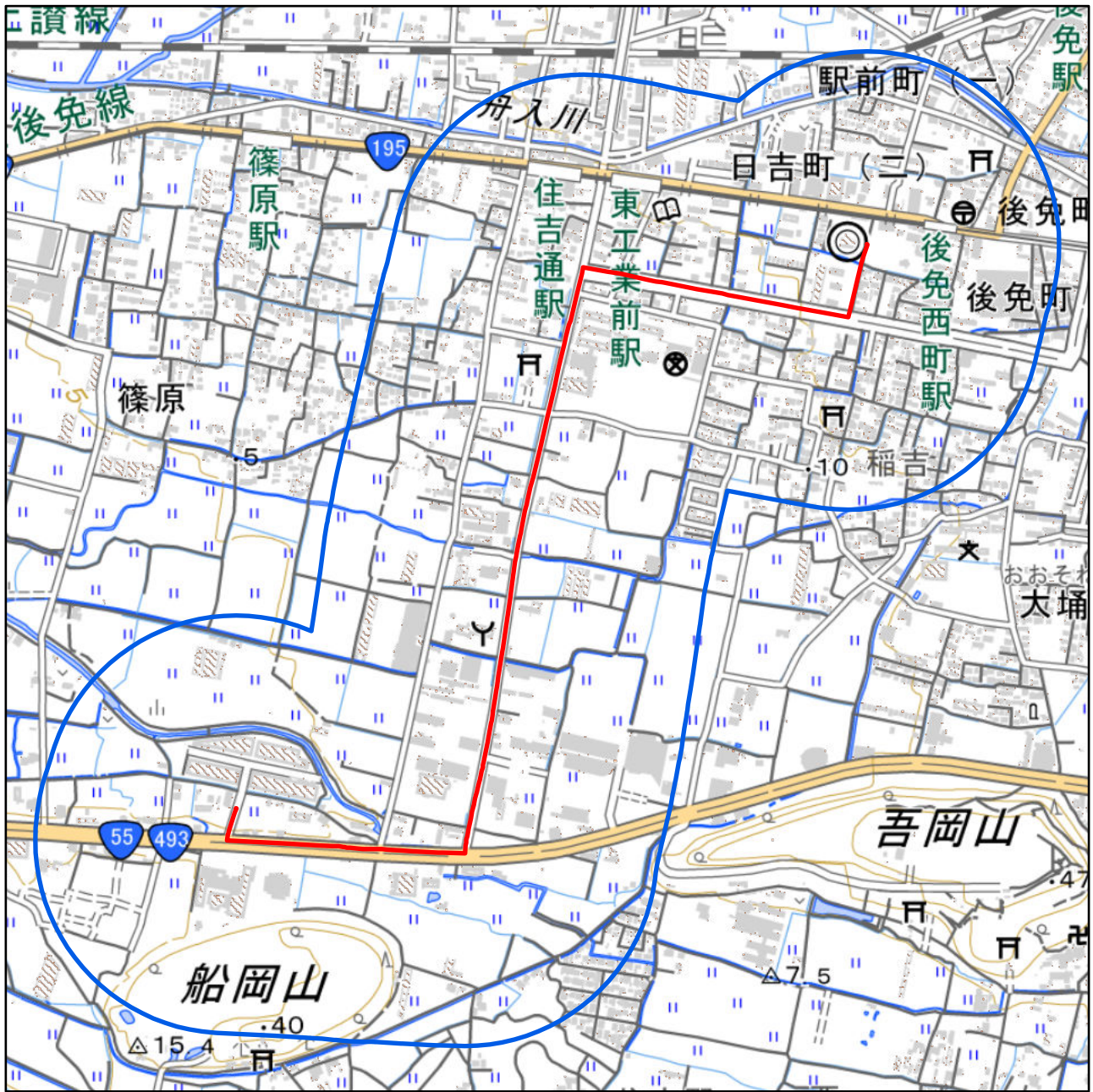
対象大会関係施設の区域