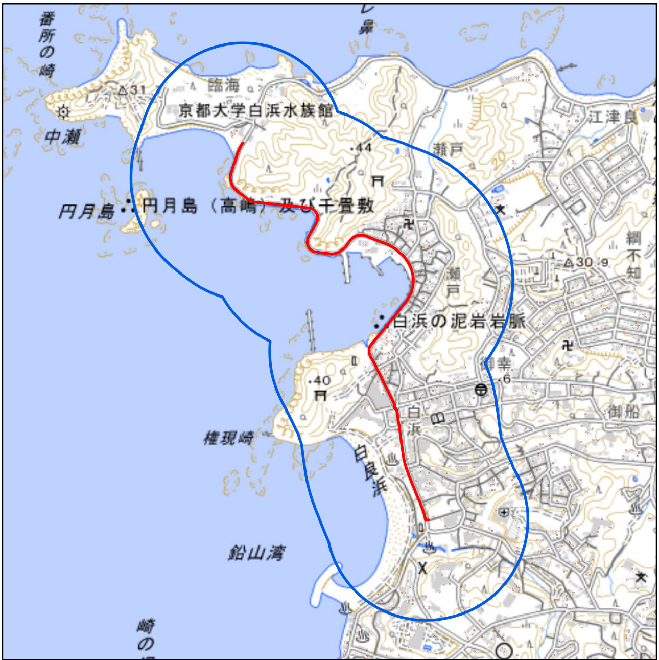
対象大会関係施設の区域