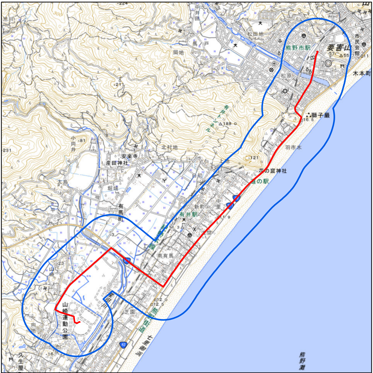
対象大会関係施設の区域