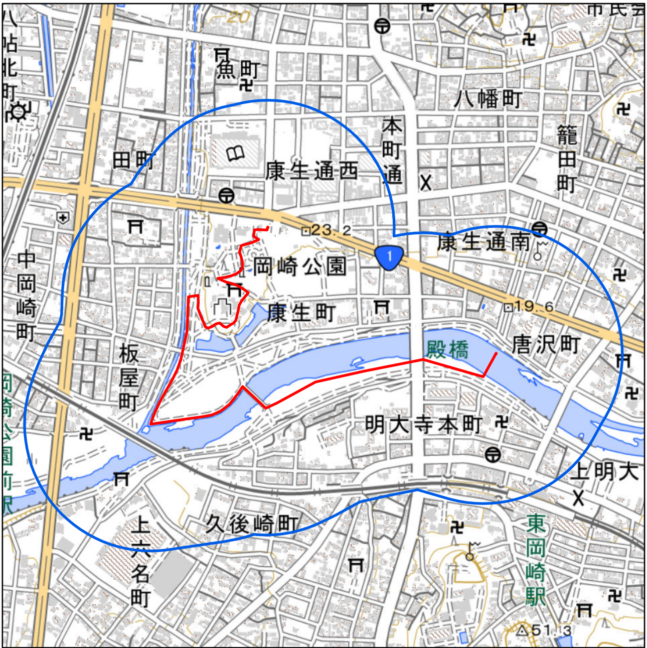
対象大会関係施設の区域