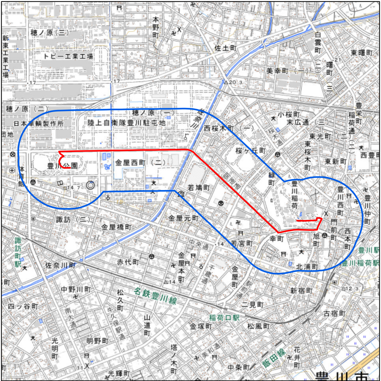
対象大会関係施設の区域