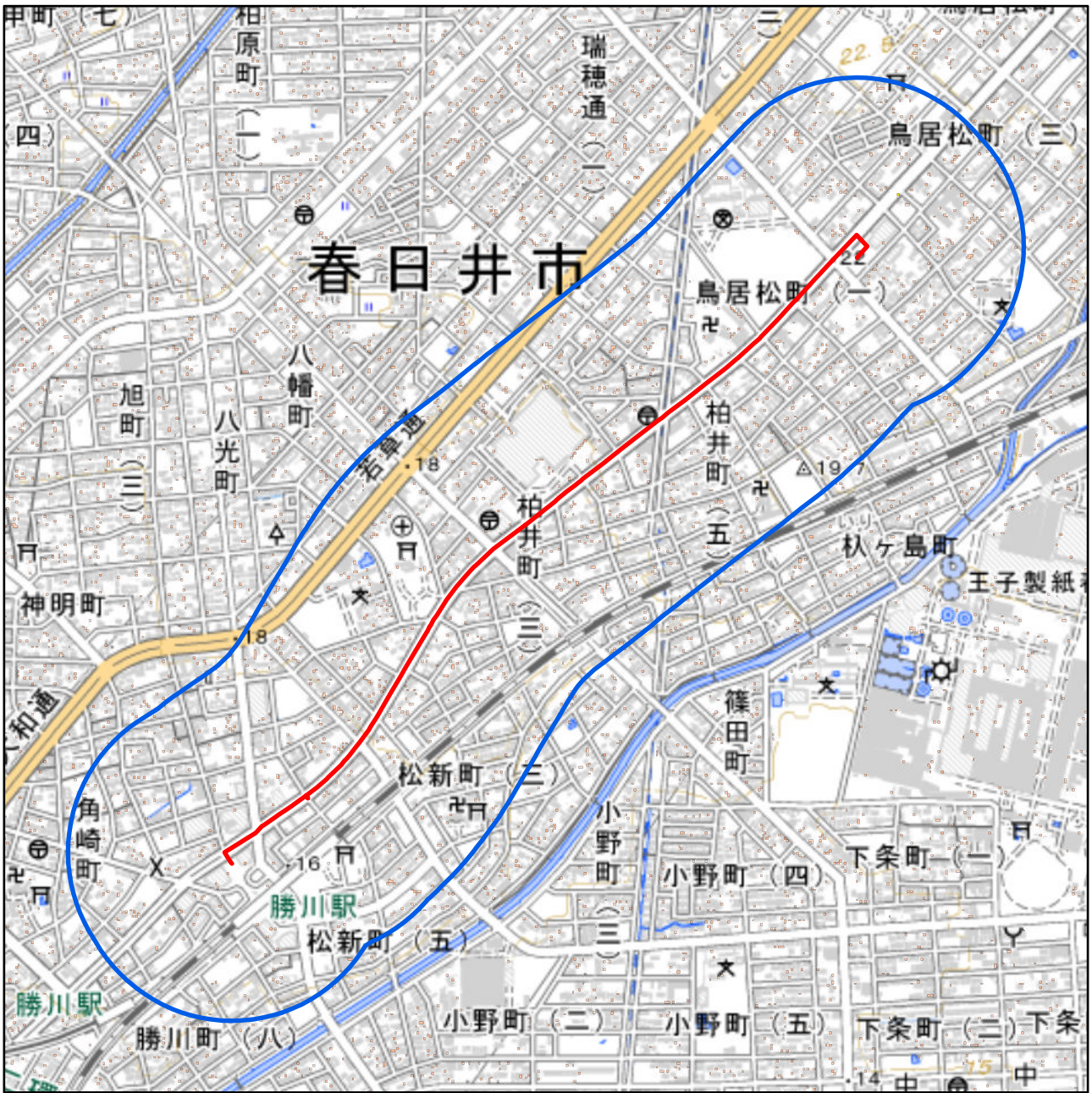
対象大会関係施設の区域