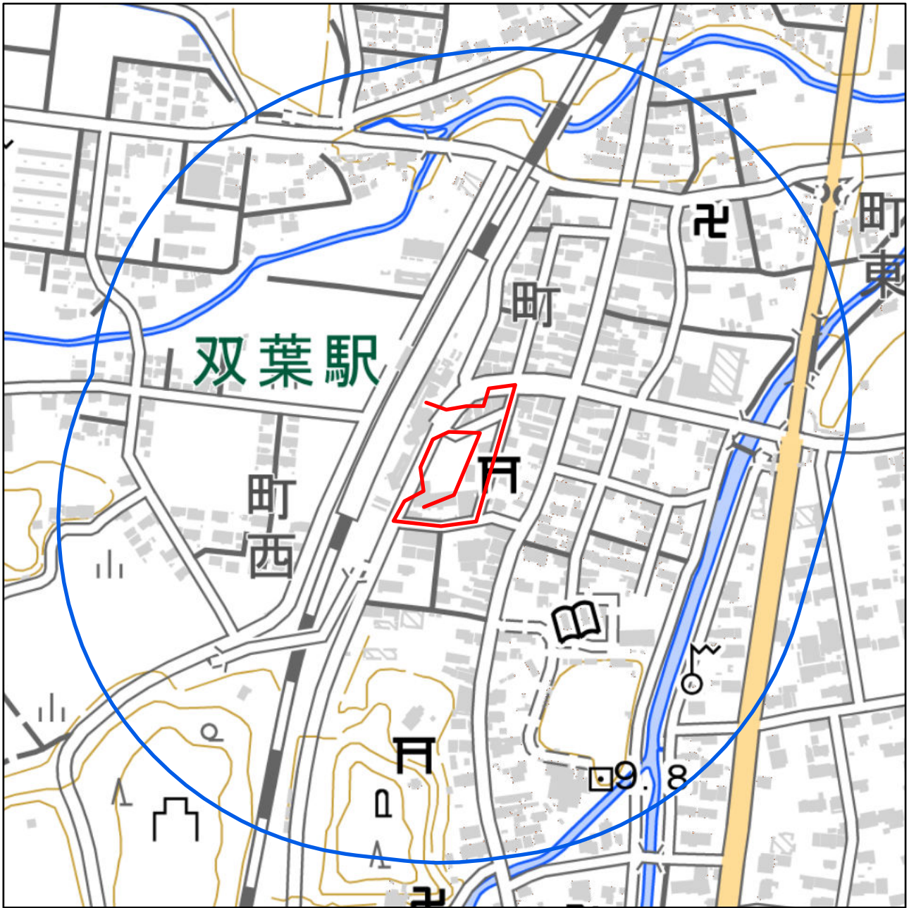
対象大会関係施設の区域