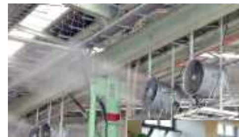
(整備の一例) 換気扇の設置