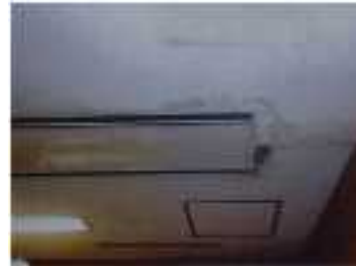
【空調設備（ファンコイル）】