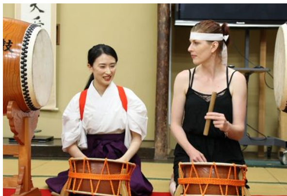
<鼓動（光月流太鼓）：朝倉市>