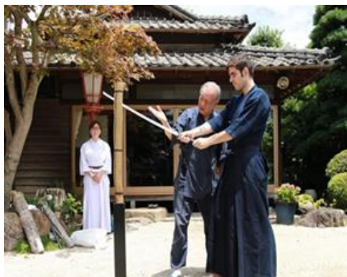
<日本刀試し斬り：大津町>