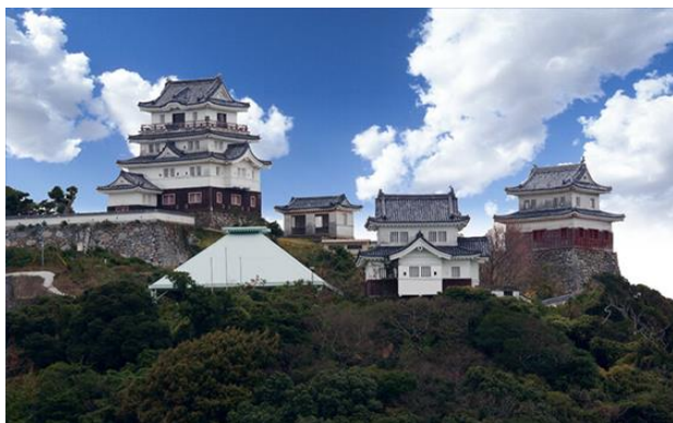
<城泊（平戸城）：平戸市>