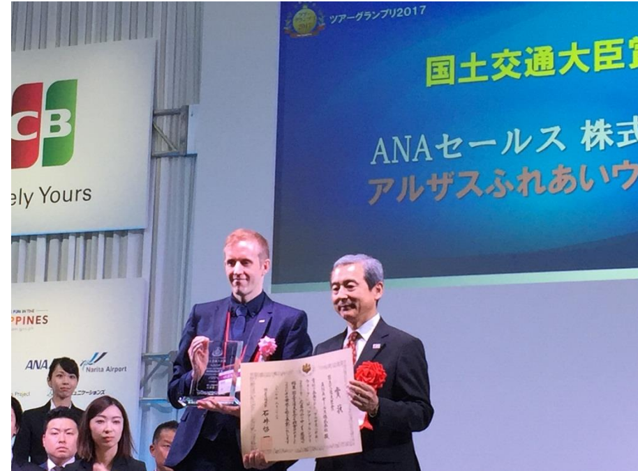
ツーリズムEXPOジャパン2017 表彰式