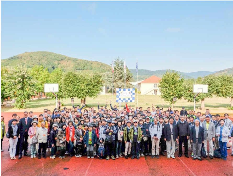
イベント当日の様子