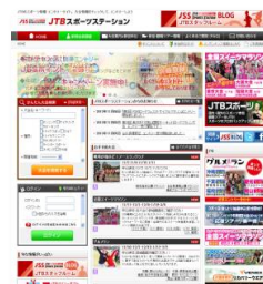
■韓国語版（仮） https://jtb sports.jp/ko/