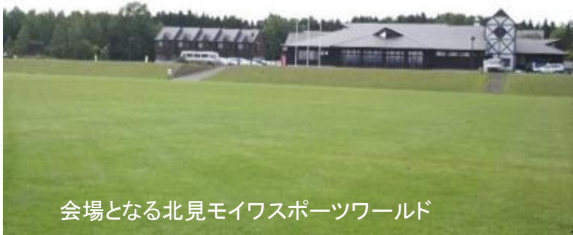
会場となる北見モイワスポーツワールド

オホーツク・スポーツ合宿・応援隊（オホーツク・スポーツ合宿誘致に係る地域連携協議会）とJTB北海道オホーツク支店北見営業所との共同企画により、管内に合宿するチームによる7人制ラグビーの大会を企画。大会では各地の7人制ラグビーの強豪チームが集結。このたびの地震の被災地である熊本県から国体選抜チームが参加。