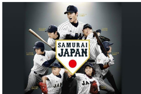
野球日本代表 「侍ジャパン」契約締結