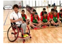
車いすバスケットボール 車いすボートボール 車いすリレー

競技用車いすを使用して行う競技です。スポーツ用に工夫された車いすならではのスピード感を楽しんだり、上半身の力を駆使してプレーします。