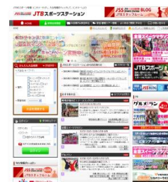
■中国語版（仮） https://jtb sports.jp/en/