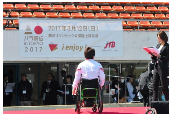
パラ駅伝 in TYO