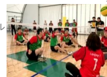
シッティングバレーボール ポッチャ

パラスポーツならではのテクニック、戦略を駆使し、チームワークと個々の能力を最大限に生かしてプレーします。