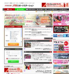
■英語版（仮） https://jtb sports.jp/en/