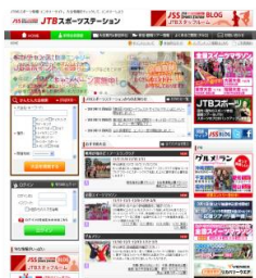
■日本語版 https://jtb sports.jp/ https://jtb sports.jp/sp/