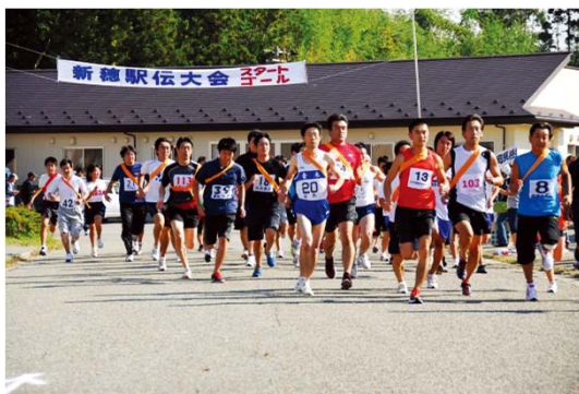
部活動単位でチームを編成、全校で参加します。