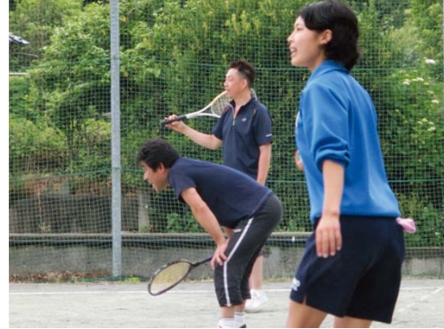
全ての部活動で、親子の真剣勝負が見られます。