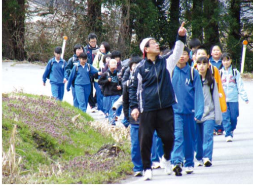
24km歩きます。国際保護鳥トキが見つかることも。