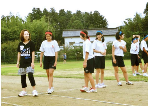
選手リレーに、保護者チームが飛び入り参加。