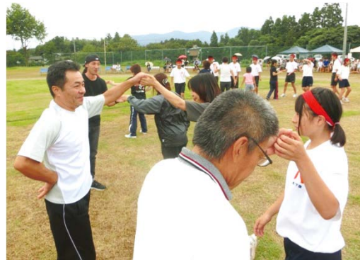
地域・家庭が一緒になってのフォークダンス。