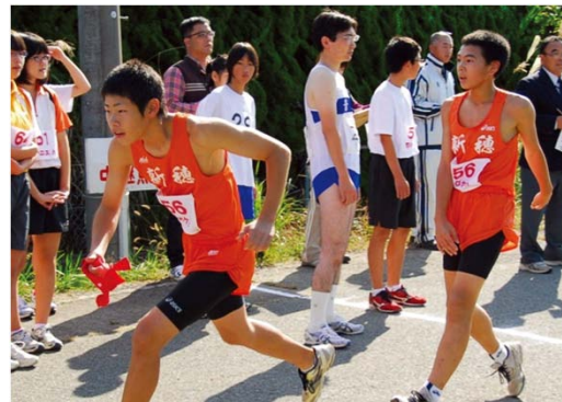
選抜チームは大人のチームに挑戦します。