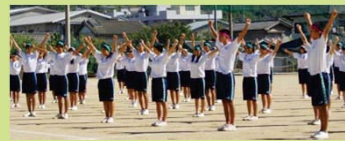
～体育祭の競技風景より～

体育祭には多くの参加種目があり、様々な種目の練習に取り組むことが体力向上につながっています。