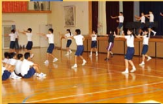
ダンスリーダーによる模範演技