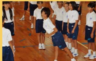
グループ練習による教え合い