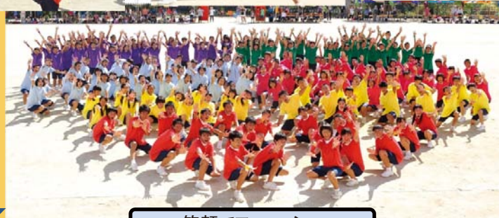
笑顔でフィニッシュ