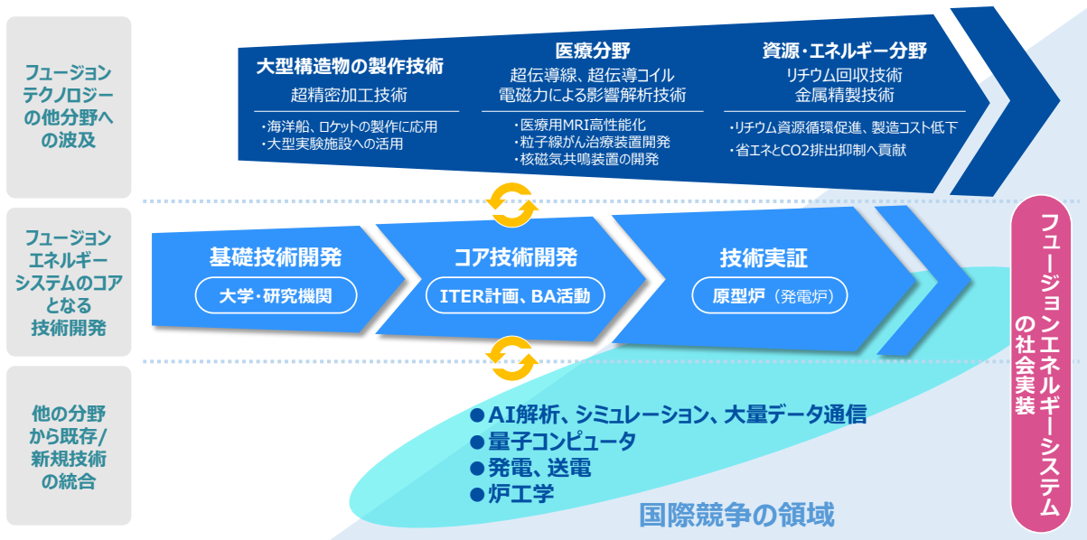
図2 社会実装に向けた研究開発や産業育成の考え方