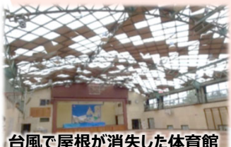
台風で屋根が消失した体育館