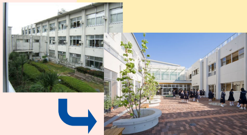
老朽化対策と一体で多様な学習活動に対応できる多目的な空間を整備