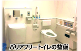
バリアフリートイレの整備