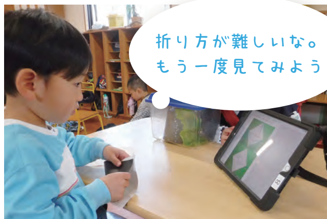
タブレットで折り方を見ている子供

数量や図形、標識や文字 などへの関心・感覚 社会生活との関わり 豊かな感性と表現 など