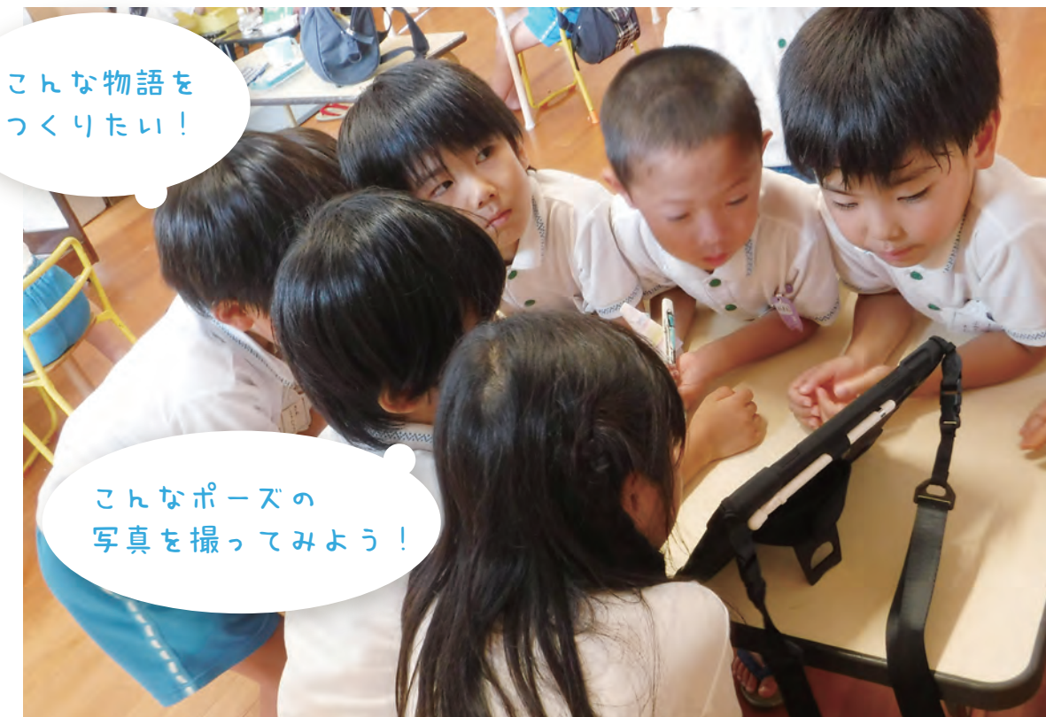
タブレットを使って物語を作成している様子

折り紙や色画用紙を使って即興で物語を演じることを楽しんでいた子供達。この経験を活かし、ICT機器やアプリケーションの使い方を理解しながら物語を作ります。考えたことを体で表現し、そのポーズを写真に撮ります。その写真を使って、友達と試行錯誤しながらタブレットで物語を作成しました。友達の異なる考えにも触れながら、自分達だけの物語を作りあげた達成感や表現する喜びを子供同士が共有し、自信へとつながります。