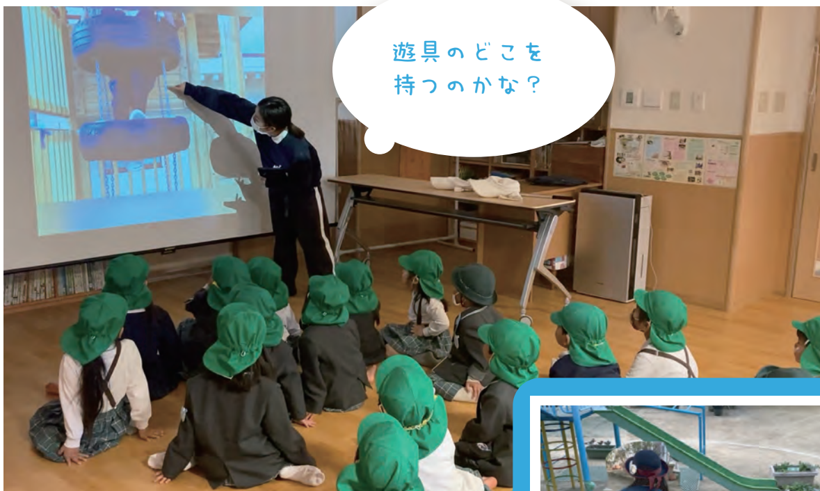
動画上映会の様子