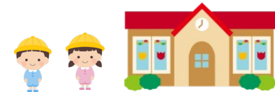
認定こども園整備の補助イメージ