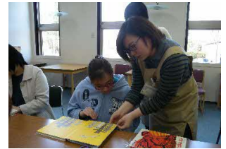
図書館での レクチャーの 様子(幕別町)