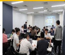
スマートIoTシステム実習 (PBLチーム演習)