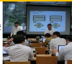
モデルベース開発演習