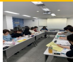
サテライトキャンパスでの授業の様子