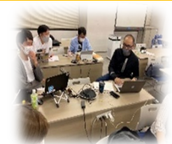
MBAの正規課程と連携し、オンラインを活用したダイナミックな授業を展開