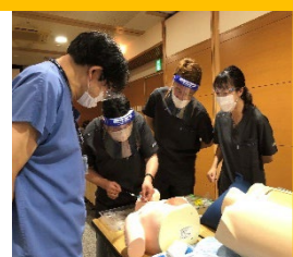
特定行為の中心静脈カテーテル抜去のスキルトレーニング