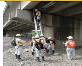
座学と演習、さらに各構造物のフィールドワークによる学習