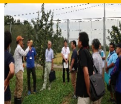
農業技術先進地研修における説明