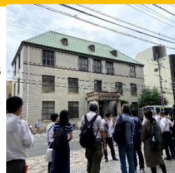
プロジェクトの最終講評会