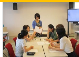
キャリアマネジメント 授業風景