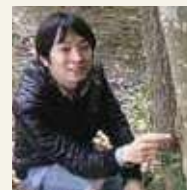
国立研究開発法人 農業・食品産業技術総合研究機構 農業環境変動研究センター 主任研究員