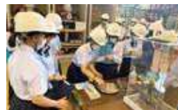
那珂核融合研究所