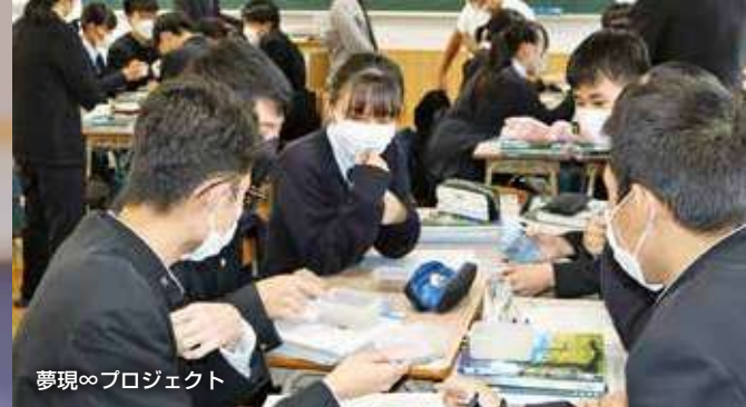
夢現∞プロジェクト

全日制課程普通科は令和6年度から県内初の新学科となり 教科科目横断型授業やSDGsの課題解決に向けた探究的な活動に取り組みながら ハイレベルな大学進学を目指す スーパーな普通科に生まれ変わります