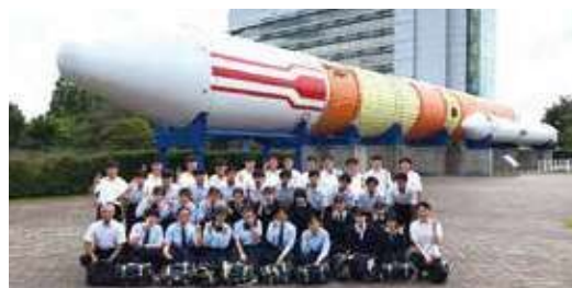
JAXA筑波宇宙センター