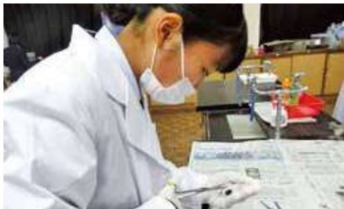
課題研究 実験の様子