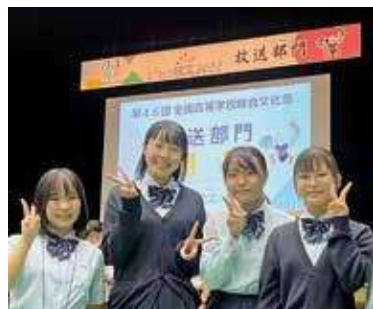
第69回NHK杯全国高校放送コンテスト 創作ラジオドラマ部門 団体優良賞 第46回全国高等学校総合文化祭 ビデオメッセージ部門 団体出場