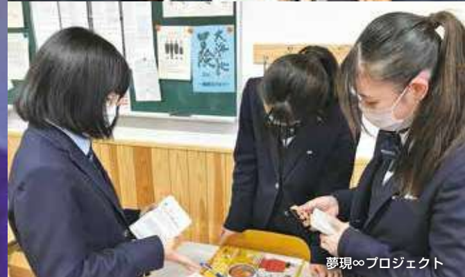
夢現∞プロジェクト