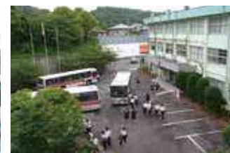
※路線バスが校内に乗り入れます