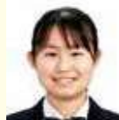
MOS(マイクロソフトオフィススペシャリスト) 世界学生大会2021 Excel365&2019部門 世界第1位

八幡高校では勉強だけではなくその他の様々な活動からも学ぶ体験ができます。私は2年次に行われる夢現∞プロジェクトで多くのことを学びました。このプロジェクトはSDGsの目標達成のために自分達が主体となって活動します。私の班では地域や市役所の方々、大学の准教授に意見を貰いながら、学校だけでなく色々な場所でプレゼンテーションを行い、活動を広めました。この経験から、一人ひとりの強みを活かすことや、自分の意志を持って行動することの重要性に気づきました。この活動を通して、私は自分の夢が見つかり、志望校決定に繋がりました。八幡高校では、この他にも教科・科目横断型授業や文化祭、クラスマッチ、体育大会といった行事に全力で取り組むことで自身の成長や学びを得ることができました。