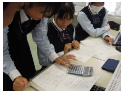
(図1) 商業科の生徒が農業科の生徒に簿記を教える様子

外部講師を活用して生徒と地域社会との接点を増やし、生徒が提案するビジネスプランをとおして、地域社会に貢献できる人材教育を目指すことを目的に授業を開始した。