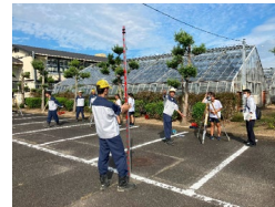
(図2) 農業科の生徒が商業科の生徒に測量を教える様子