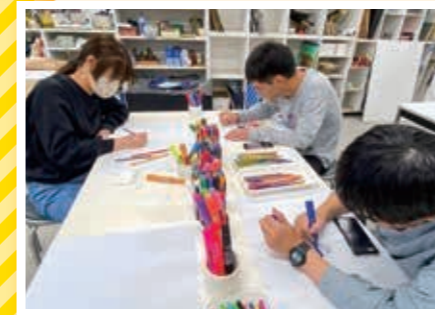
アートワークショップ(大分大学「生涯学習講座」)