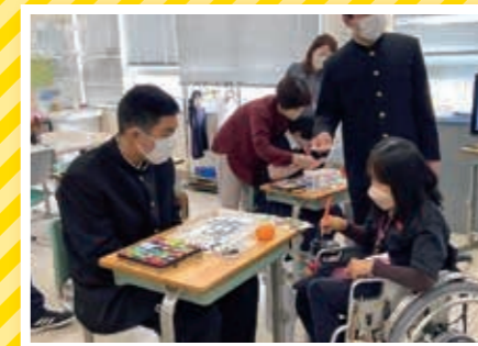
絵手紙講座(特別支援学校出前講座)