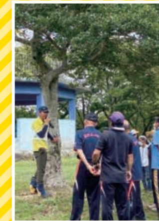
自然散策 (香々地青少年の家「ワンデイキャンプ」)