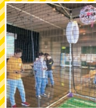
ドローンサッカーを体験! あすびあフェスタ(大分大学「生涯学習講座」)