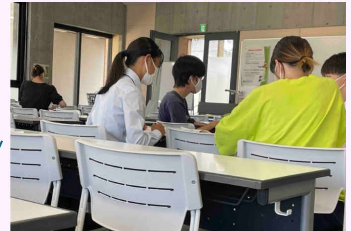
大学生とのグループワーク