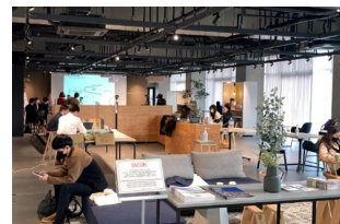
国内外の大学や企業との連携拠点