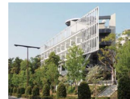
県や市と連携して地域防災支援を行う活動拠点