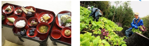
山形県鶴岡市 (2014年、食文化)