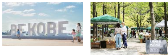
兵庫県神戸市 (2008年、デザイン)