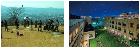
山形県山形市 (2017年、映画)