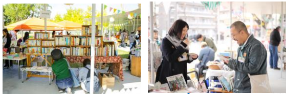
岡山県岡山市 (2023年、文学)