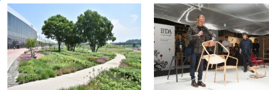
北海道旭川市 (2019年、デザイン)