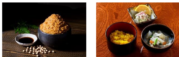
大分県臼杵市 (2021年、食文化)