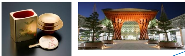
石川県金沢市 (2009年、クラフト&フォークアート)