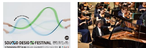
静岡県浜松市 (2014年、音楽)