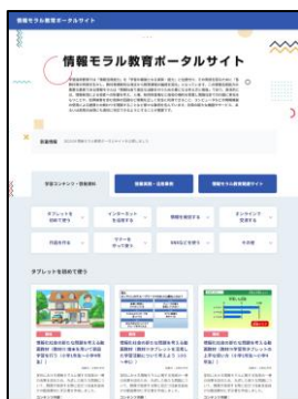
〈情報モラル教育ポータルサイト〉