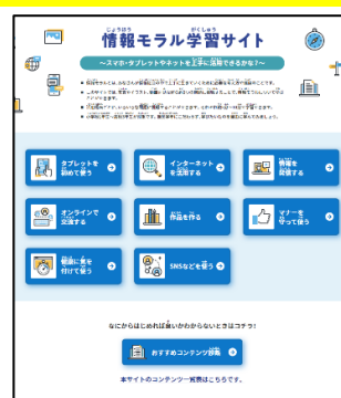
〈情報モラル学習サイト〉

https://www.mext.go.jp/zyoukatsu/moral/index.html