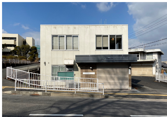
（「Smile Farm かんまき」 外観）

「Smile Farm かんまき」の運営に当たっては、子どもたちを支援する事業拠点として、新たに整備された当該施設を活用しています。