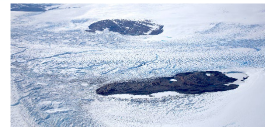
図4.観測予定の氷河