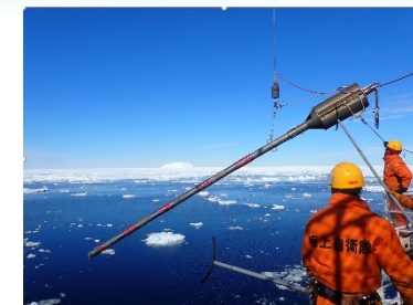
図3.海底堆積物採取の様子