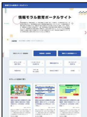
〈情報モラル教育ポータルサイト〉