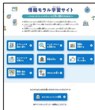
〈情報モラル学習サイト〉

https://www.mext.go.jp/zyoukatsu/moral/index.html