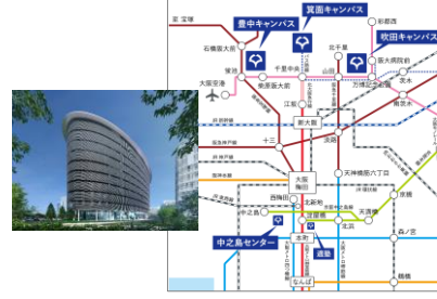
各キャンパスの立地や研究領域の特性を生かしつつ、キャンパス全体のワークアビリティを高めるなど、特色ある共創拠点化を推進