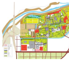
地元産業と連携した拠点づくりをはじめ、ものづくりや医療、食などの各分野からキャンパス全体の共創拠点化を推進