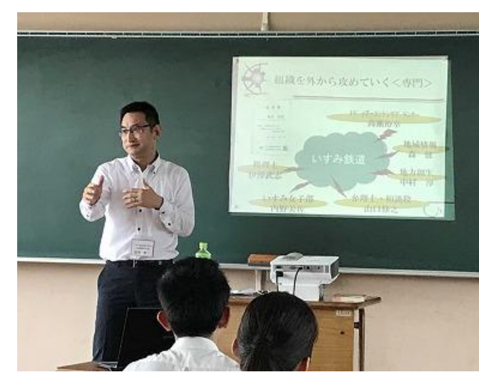
上 いすみ鉄道社長による出前授業の様子です。

左 生徒(1年次)の制作したポスターの一つです。このポスターの生徒は2年になりいすみ鉄道とそれをつなぐ小湊鐵道を利用した千葉県横断マップを制作しています。