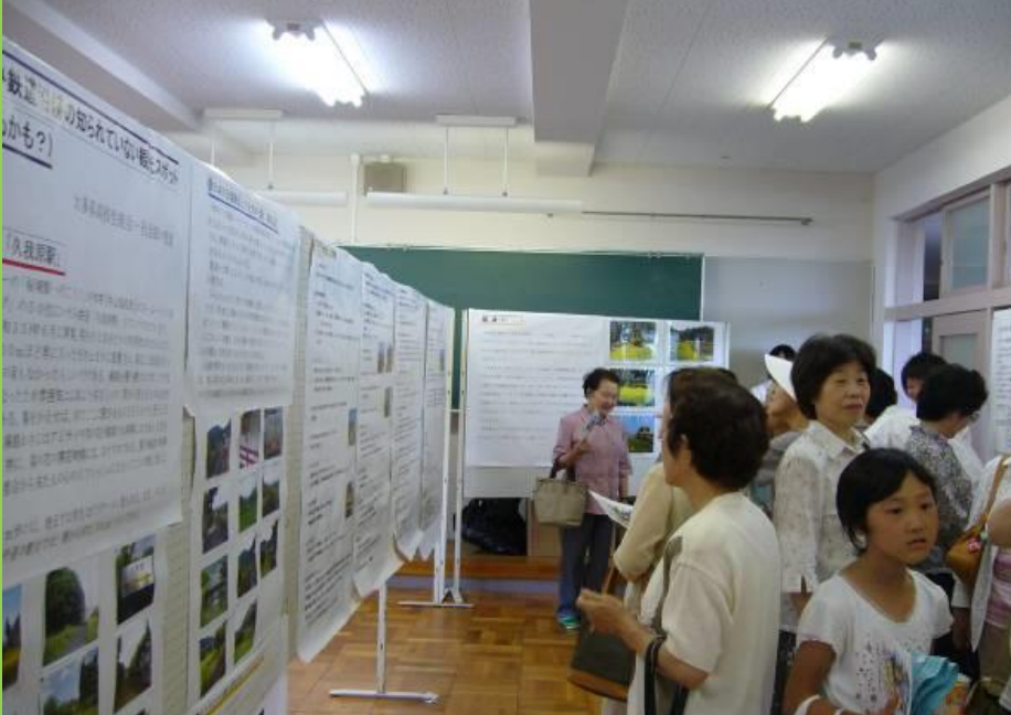
平成19年～文化祭にていすみ鉄道について展示