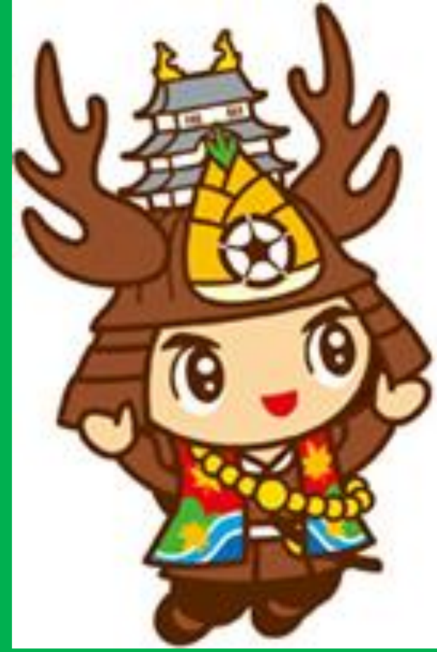
大多喜町キャラクターおたつきー