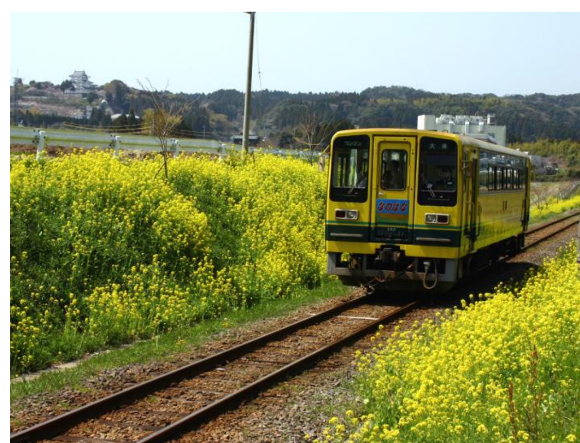
右 いすみ鉄道と菜の花

本校は今年度創立120周年記念式典を終えました。学校はお城の下にあり、生徒は黄色いかわいらしい電車「いすみ鉄道」で通学しています。「いすみ鉄道」は旧国鉄時代「木原線」として昔から大多喜高校生の足として親しまれています。これからも大多喜高校は「いすみ鉄道」と「大多喜城」を支援していきます。