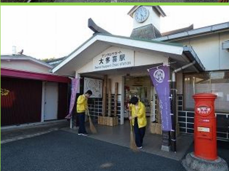
マンドリングター列車、いすみ鉄道駅舎清掃活動は現在も続いています。