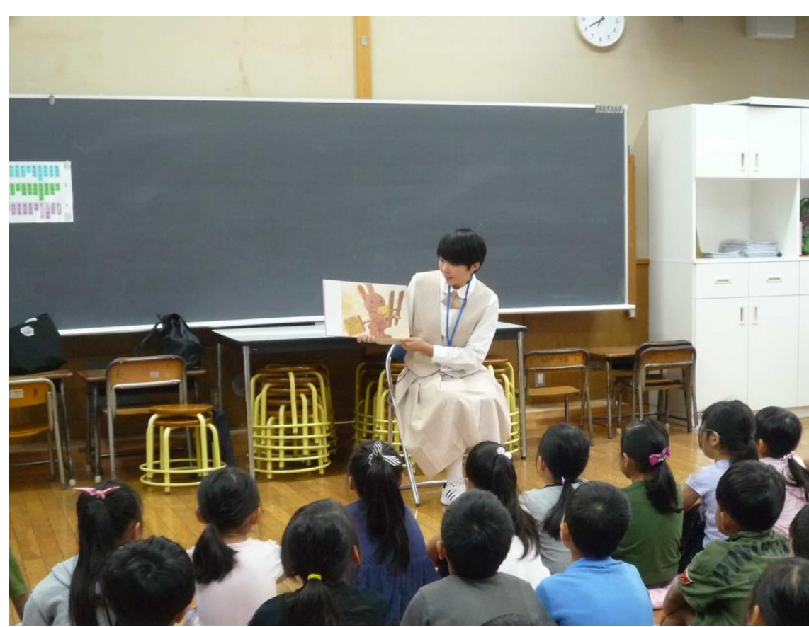
左上 大多喜小学校への読み聞かせの様子です。

本校では自治体へのインターンシップや、幼稚園・小中学生との交流を積極的に行っている。「大多喜町企業連絡協議会」を窓口としてインターンシップを行うことにより地元へ就職する生徒を一人でも多く輩出していきたいと考えてます。