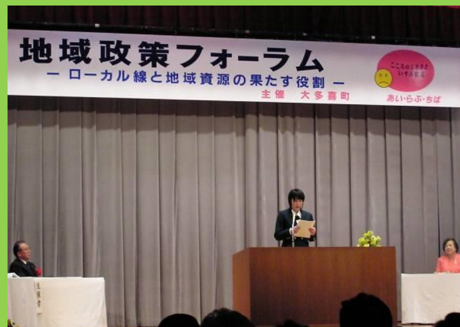
平成16年「地域政策フォーラム」あたりから活動しています