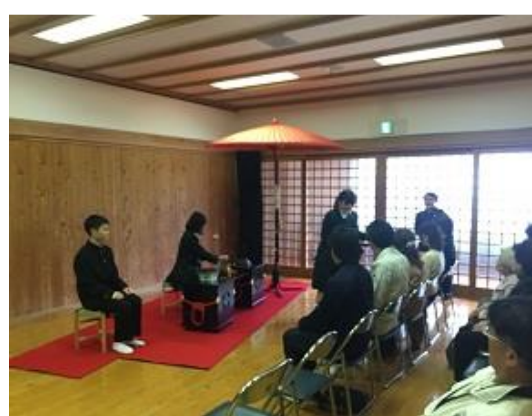
左 お城まつりの様子です。茶道部がお手前をします。