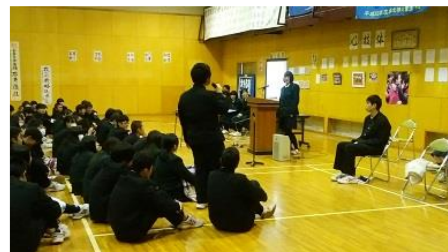
右上 ビブリオバトル学年大会の様子です。