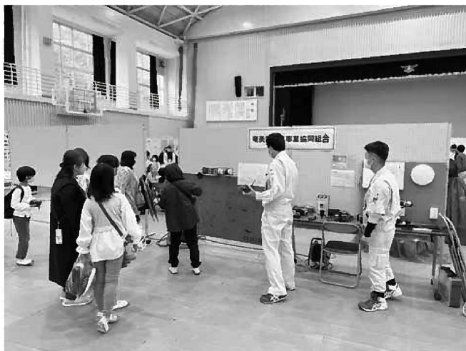
【奄美電気工事業協同組合】奄美の地図のビリビリゲーム みんなでタイムを競って楽しんでました！