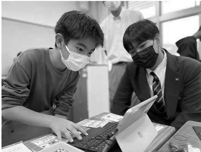
プログラミング教材「Akadako」を使用してのプログラミング講座 リアルタイムで反応があり楽しくプログラミングを学ぶことができます！