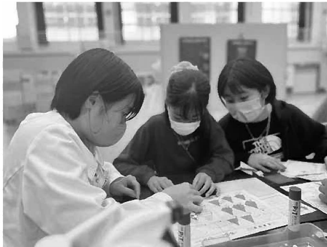
【家政科】折り紙を使ったカレンダーづくり体験をしました！