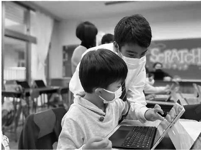
【商業・情報処理科】Scratchプログラミング教室も大盛況でした！小学生はマスターするのが早い！