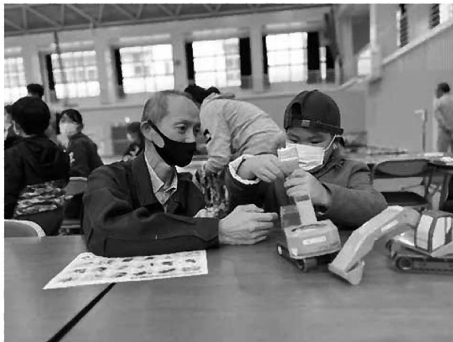
【奄美建設業協会】重機の模型制作が大人気でした！