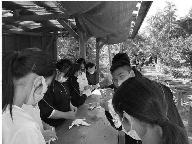
【絞り作業】 できあがりを想像しながら、輪ゴムを使って布を絞ります。

染色についての説明を聞いた後、一人ずつ輪ゴムを使って布を絞り、染める準備をしました。