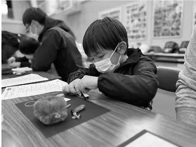
【機械電気科】電気工作に夢中です。真剣に取り組んでくれて嬉しいです！