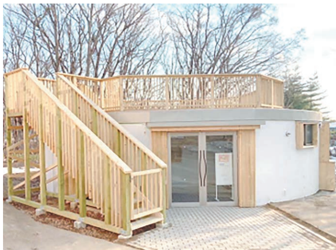
北海道教育大学岩見沢校「森の岩ギャラリー」

会 期: 2022年12月1日(木)～12月7日(水) 会 場: 北海道教育大学岩見沢校「森の岩ギャラリー」 出展数等: 25名、110作品