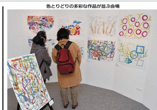
色とりどりの多彩な作品が並ぶ会場

アートアカデミー参加者展覧会 森の岩見沢アートを12月17日に開催する。市生涯学習センターいわなびで開く。市生涯学習センターいわなびで開く。市生涯学習センターいわなびで開く。